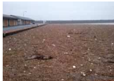
流木流入状況写真(H30.7 豪雨)