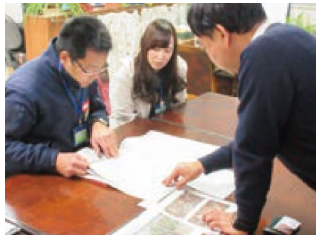
専門家と支援内容について協議