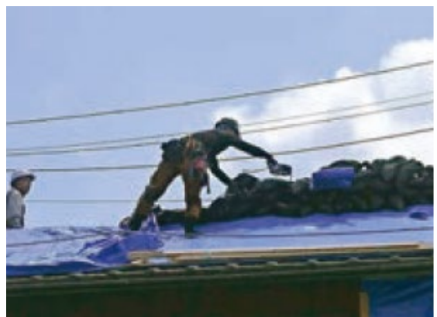
復興支援隊 縁による屋根の修繕