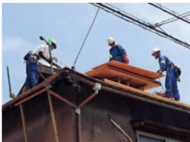
復興支援隊 縁による屋根の修繕