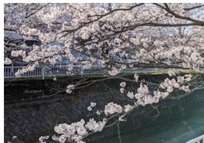
朝の散歩は気持ちいい！

新年度が始まり新たなスタートがあった方も多いでしょうか。倉吉の桜もあっという間に、満開を迎えすでに葉桜の頃となっています。皆さんから、さくらだよりや、身近な「春」が届きました。