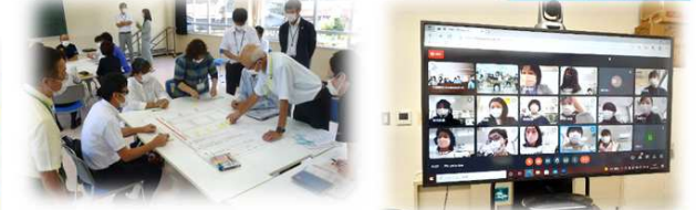
根雨小・黒坂小 ふるさとキャリア教育を 校内研修の柱に据えた実践 (合同研修会・合同授業研究会)