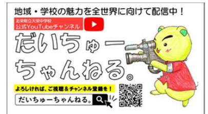
YouTu部 (大栄中) 特色ある学校づくりの一環として 地域の魅力を生徒が動画配信