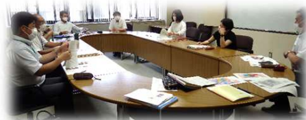
八頭町キャリア教育 担当者連絡協議会 (年3回開催)