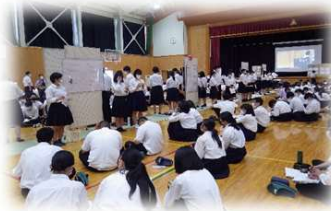
八頭高校の ふるさとキャリア教育 「翠陵探究」