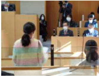
ふるさと日野の魅力を 広めよう (黒坂小6年生・総合) 魅力の伝え方を県内修学 旅行の見学先などを参考に、 町の魅力の伝え方を 探究して町議会で提案