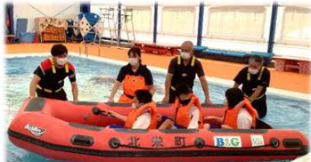
北栄町防災の取組 (北条中1年生・総合)