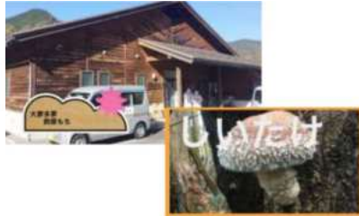
日野町の食を盛り上げよう (根雨小5年生・総合) 動画作成を通して