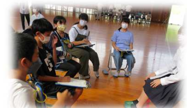
ふるさとについて学んだことを 発表したり聞き合ったりする 町内小中高交流学習