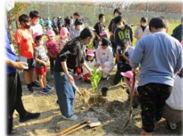
地域の多目的広場に 植樹をしよう (北条小6年生・総合) 園児・地域の人と植樹