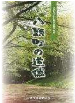
小中学校 道徳科 「町の出身者を題材にした学習」