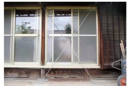
<低コスト耐震改修工法の事例>