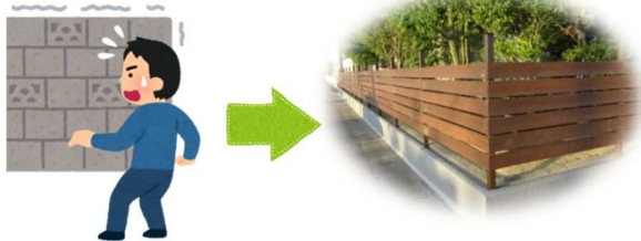
<コンクリートブロック塀から木塀への改修>