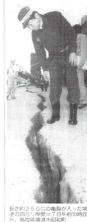
厚さ約2.50cmの亀裂が入った堤原の四方。7日午前10時20分、鳥取県東郷市和町。