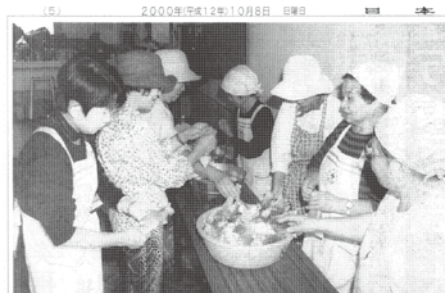
炊き出しをするボランティアグループ。7日午前10時45分、鳥取県米子市餅町1丁目のふれあいの里。