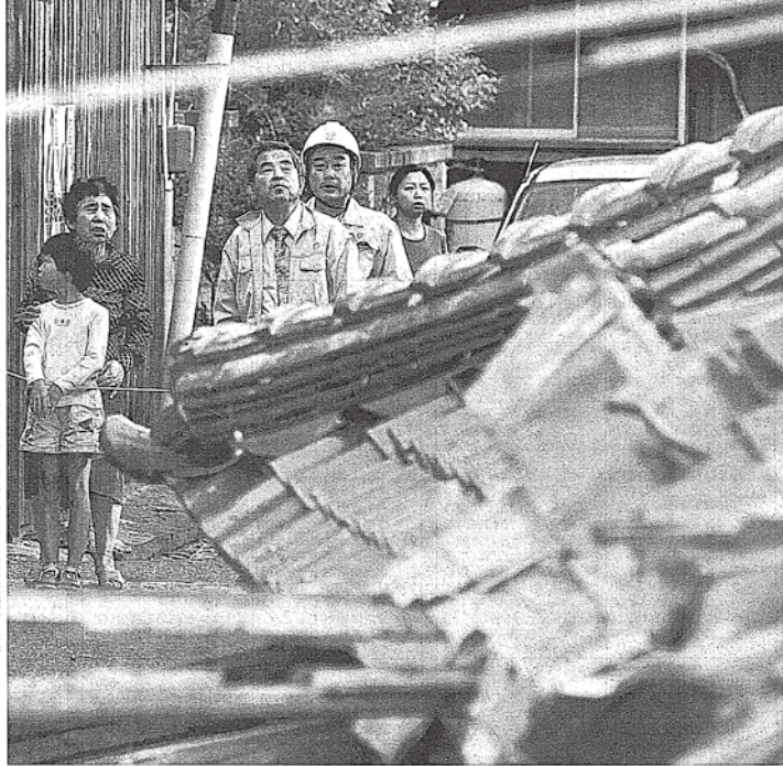
余震は揺れも出る。鳥取県鳥取市東町。地震発生後、約6分後、約6分、鳥取県東郷市、東町。

鳥取県西部を震源地とする前日(6日)午後11時、約7.3の強い地震。震源は北緯35度54分、東経133度16分、深さ約10キロメートル。この地震は、鳥取県西部を中心に、人々の命を奪った。土砂崩れなどの被害が相次いだほか、交通の混乱も起きた。「怖くて急ぎ止まらな」「避難先もありません」。ショックで震れ、住民は恐怖を感じながら、大げな夜を過ごした。