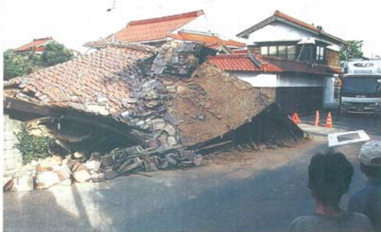
家は半壊も崩れ落ちた民家—6日午後3時すぎ、鳥取県米子市和歌町