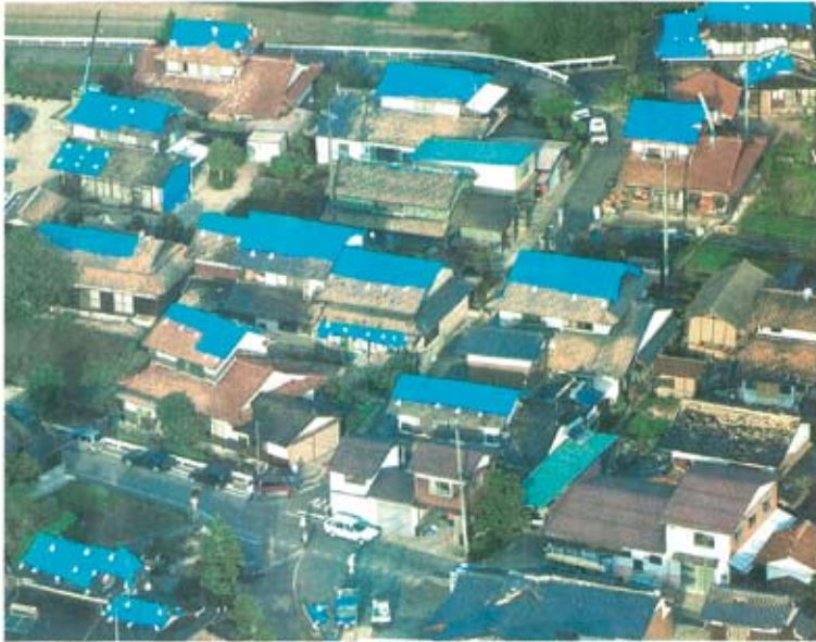
間に備えて屋根にビニールシートが掛けられた地域で被害を受けた民家。7日午後4時10分、鳥取県日野町で共同通信社ヘリから