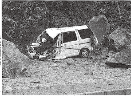
軽自動車に直撃した土砂崩れ。鳥取県西部地震で倒壊した家屋の瓦礫。鳥取市、鳥取県西部地震で倒壊した家屋の瓦礫。

鳥取県西部地震で、鳥取市、鳥取県西部地震で倒壊した家屋の瓦礫。鳥取市、鳥取県西部地震で倒壊した家屋の瓦礫。鳥取市、鳥取県西部地震で倒壊した家屋の瓦礫。