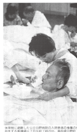
体育館に避難した公立日野病院の入院患者の食事の世話をする看護婦。7日午前7時25分、鳥取県日野町。