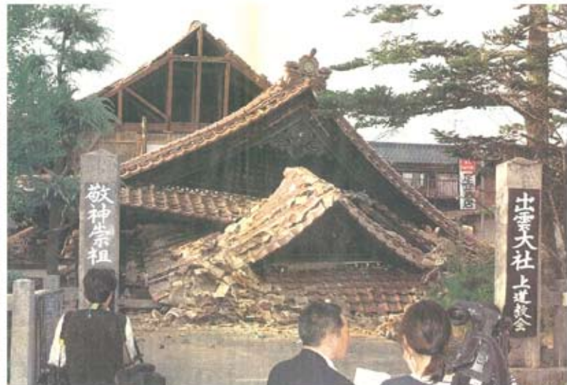
鳥取西部地震の影響で、倒壊した出雲大社上道教会。6日午後4時30分、鳥取県境町市上道町