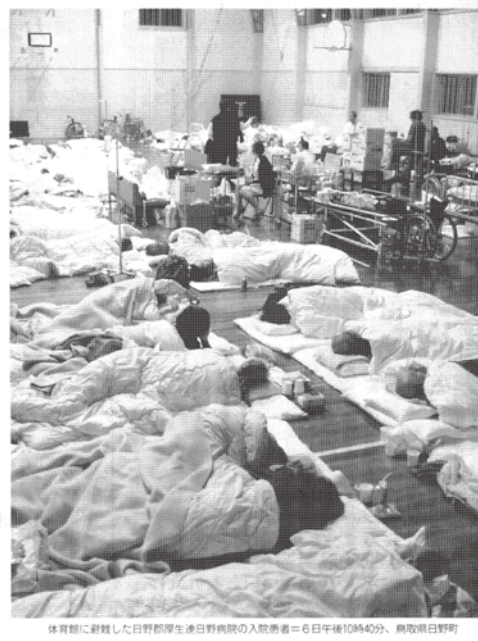
体育館に避難した日野郡厚生連日野病院の入院患者。6日午後10時40分、鳥取県日野町。