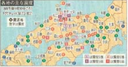
各地の主な震度 (6時を境に時刻が変る) 予知は震度 震害は震度

鳥取県鳥取市西伯町に発生した地震で、鳥取県内各地で被害が広がった。鳥取県内各地で、地震による被害が広がった。鳥取県内各地で、地震による被害が広がった。鳥取県内各地で、地震による被害が広がった。