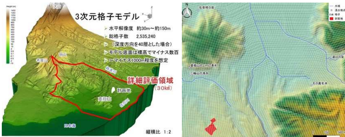
図2 三次元格子モデル(左:全域、右:拡大図)