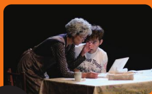
ゲスト 10/16(土)・17(日) 両日 13:00~ じゆう劇場