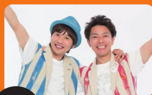
ゲスト 10/17(日) 14:00~ ロケットくれよん