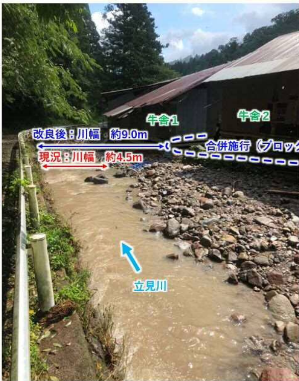
立見川(下流側を望む)