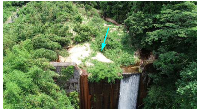
【岩倉川砂防堰堤の堆砂状況】