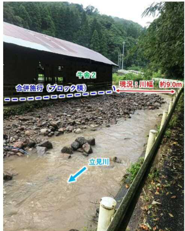
立見川(上流側を望む)