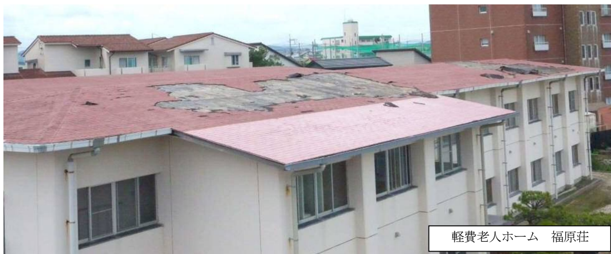
軽費老人ホーム 福原荘