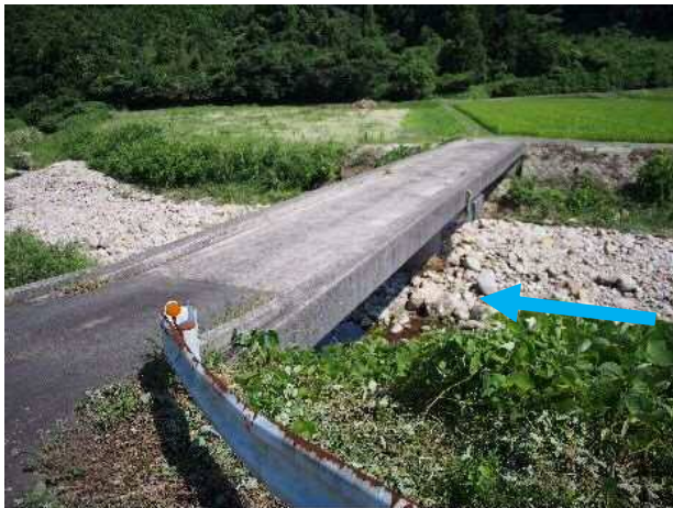
北谷川土砂堆積状況（左岸側から望む）