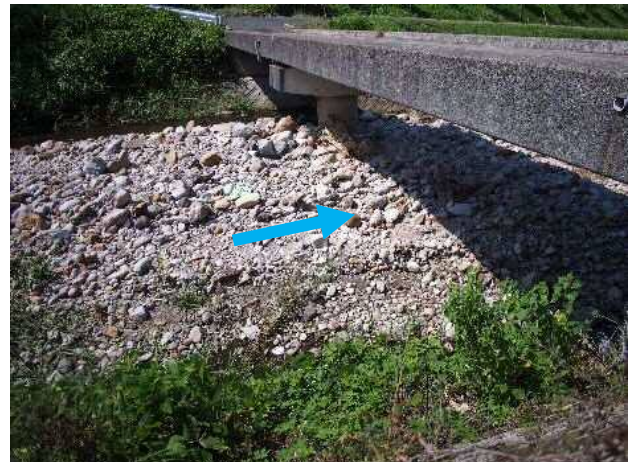
北谷川土砂堆積状況（右岸側から望む）