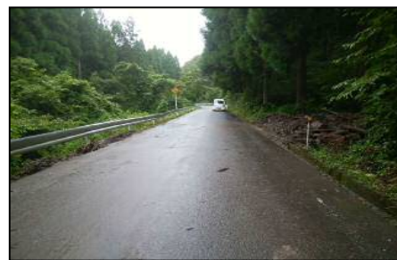
応急復旧工事完了後