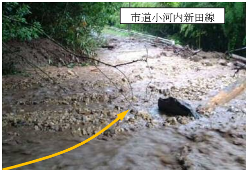
鳥取市小河内地区