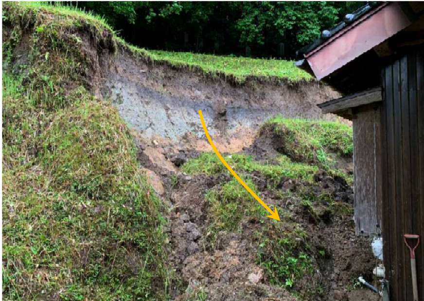
倉吉市河来見地区