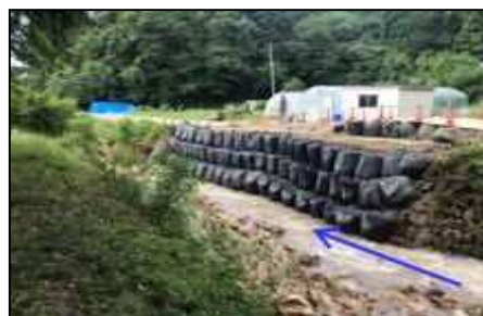
応急復旧工事完了後