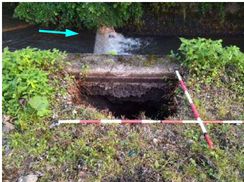
【東谷川 護岸天端の陥没】