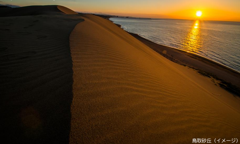
鳥取砂丘（イメージ）