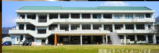
画像はすべてイメージです