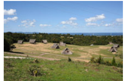
弥生時代の大量集落 妻木晩田遺跡 復元建物群

※第1回の講座内容は後日、教育センター学校教育支援サイト等に掲載予定です。掲載については、当埋蔵文化財センターホームページにてお知らせします。