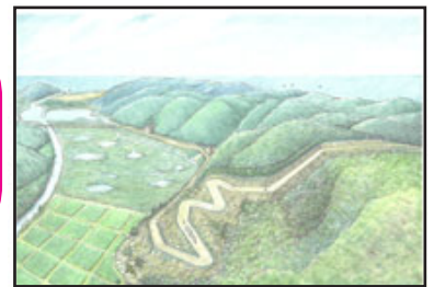
連続したヘアピンカーブを確認 全国初のつづら折りの古代山陰道 (復元イラスト)

奈良時代、平安時代は貴族中心の律令国家の時代と教科書には書かれています。では律令国家を支えた社会体制の基盤に全国を結ぶ官道(古代の道)が見えてきます。鳥取でも見つけた古代山陰道(官道)から分かる当時の社会について遺跡や出土品を教材にした授業づくりをします。