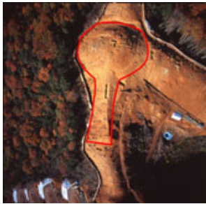
山陰最古級の前方後円墳 本高14号墳