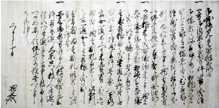
永禄7年(1564)平佐就之書状(鳥取県立博物館蔵『宮本家文書』)★