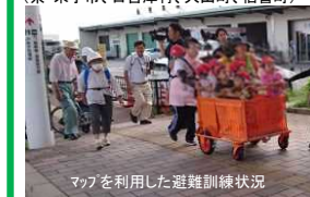
マップを利用した避難訓練状況