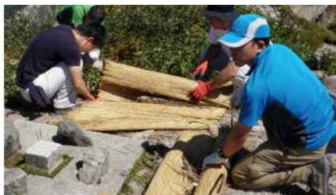
植生復元のためのこも伏せ