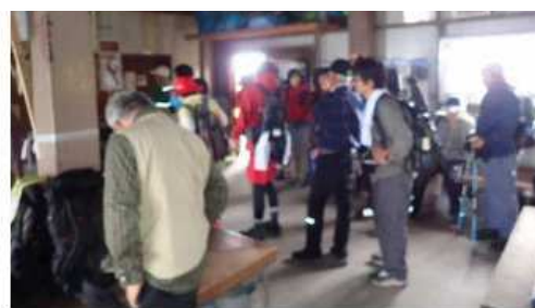
山頂水洗トイレの保守清掃