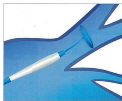
1. 診断カテーテルを肺静脈に留置

クライオアブレーションは、4本の肺静脈を1本ずつ30mm程の大きさの風船（クライオバルーン）を膨らませ冷凍凝固することで、心房細動を起こす異常な電気信号を遮断し、再び心房細動が起こらないようにします。高周波アブレーションよりも1時間以上治療時間が短く、さらには脳梗塞などの合併症率もこれまで以上に低くなるなど有効かつ体に優しい治療法です。当院では、患者様に寄り添い安全で安心な治療法を提供してまいります。