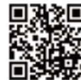
第四波対策飲食店等感染防止 強化緊急応援事業