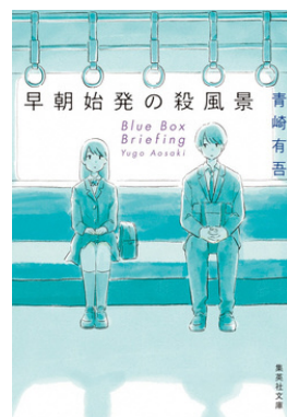
『早朝始発の殺風景』 青崎有吾／著 集英社文庫

恋愛関係にも依存関係にもないが互恵関係にある小嶋常悟朗と小佐内ゆきは、春期限定のいちごタルトをめぐる不可解な出来事をきっかけに、ささやかな事件の裏に潜む人間関係や思惑を解き明かしていく。目立たず慎ましい「小市民」を目指す2人の関係とそれぞれに隠された過去とは。