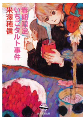
『春期限定いちごタルト事件』 米澤穂信／著 東京創元社

かつてカルトと批判された〈ミライの学校〉の敷地から子どもの白骨死体が発見される。関係者が過去を振り返る中で、理想を掲げた大人たちと子どもたちの思いが浮かび上がる。集団の中で生きる難しさや、理想と現実で揺れる人々の姿を通して、「正しさ」とは何か、人との関わりや社会との向き合い方を考えさせられる一冊。