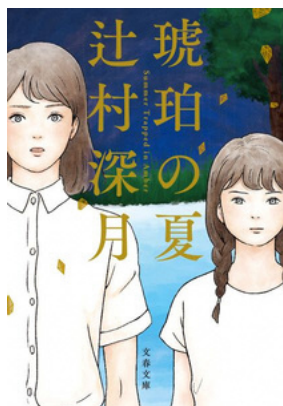
『琥珀の夏』 辻村深月／著 文春文庫

本のプロである書店の方たちに、中学生・高校生の皆さんにぜひ読んでほしい本を3冊推薦していただきました。この中で気に入った本を読んで感じた魅力をポップで表現してください！