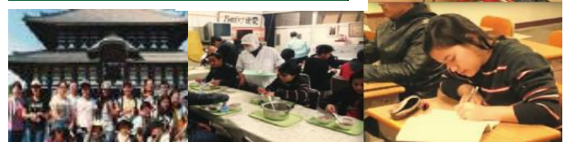
（文部科学省フライヤー「夜間中学を、知っていますか？」より）