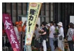
のこう市場 大盛況