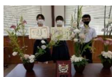
フラワーアレンジメント競技会