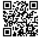
学校ホームページ