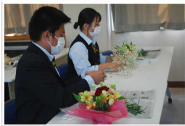
フラワーデザイン：フラワーアレンジメント