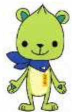
スクールキャラクター ちのりん

インターンシップや長期就業体験（デュアルシステム）、面接対策セミナーなど、3年間を通して進路の実現を目指します。