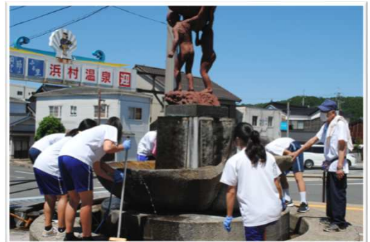
地域の方と協働して、JR浜村駅前足湯の清掃活動