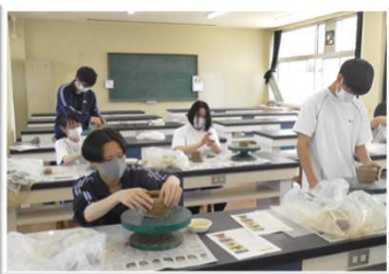
弥生文化探究：弥生土器づくり

総合学科ならではの特色ある授業がたくさん！！ 体験活動や探究活動をとおり、「できる」を増やしながら学びを深めています！ 特にR3年は、青谷学における文学歴史グループが、第15回全国高校生歴史フォーラム（地歴甲子園）で最高賞の知事賞を受賞しました！