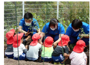
ちづ保育園との交流

農業技術を活用した福祉・保育に関する活動を通して、福祉マインドやコミュニケーション能力を高める学習をします。