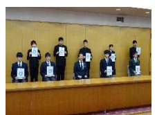
スーパー農林水産業士認証取得