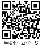
学校ホームページ

〒681-0003 鳥取県岩美郡岩美町浦富708番地2 TEL (0857) 72-0474 FAX (0857) 72-3445 MAIL iwami-h@mailk.torikyo.ed.jp 学校HP https://cmsweb2.torikyo.ed.jp/iwami-h/