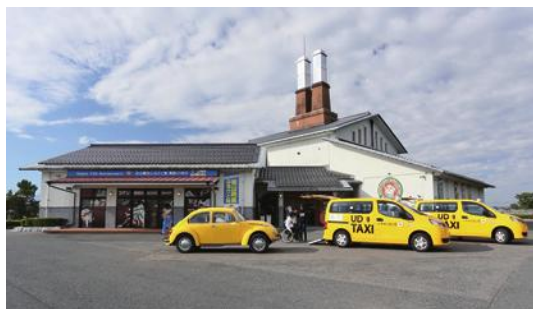
↑あがさ博士のビートルとUDタクシーがコラボしているようです。