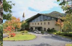
↑大野池の湖畔にある「大山レイクホテル」の池のたもとからカヤック体験は行われます。