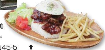
↑ポリューミーな「大山ハーブどりのロコから」(ポテト付き)。

〒689-3318 鳥取県西伯郡大山町大山45-5 TEL.050-5241-2022(駐車場あり) 営業時間/11:30~16:00(15:30ラストオーダー)