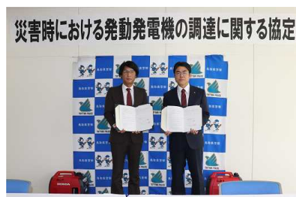
【協定締結式の状況】