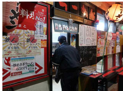
【飲酒運転根絶広報】