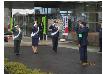
【一日警察署長による出動式】