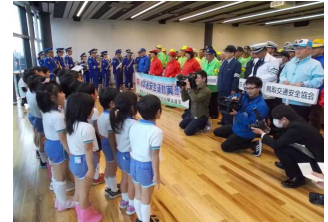
【交通安全県民運動開始式】