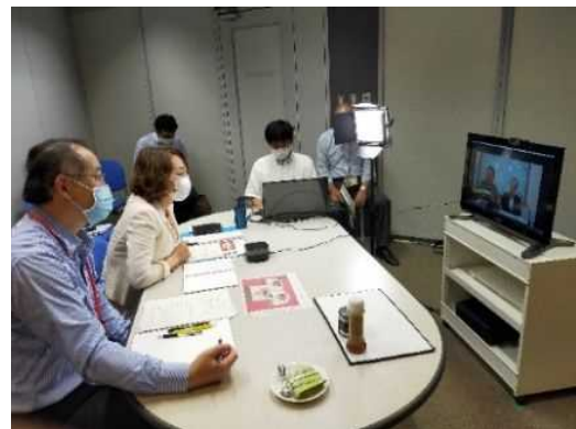
とっとり国際BCのWebミーティングルームを活用したWeb商談会