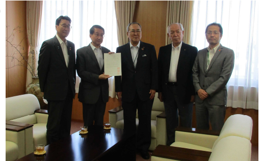
（鳥取県商工会議所連合会への要請）