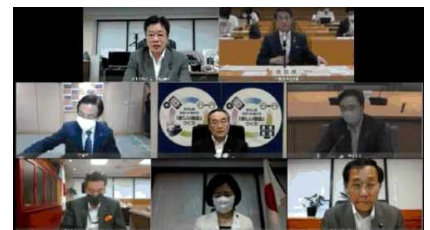
（加藤厚生労働大臣へのWeb要望）