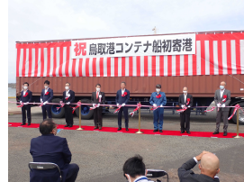
鳥取港コンテナ試験輸送（令和2年9月22日）