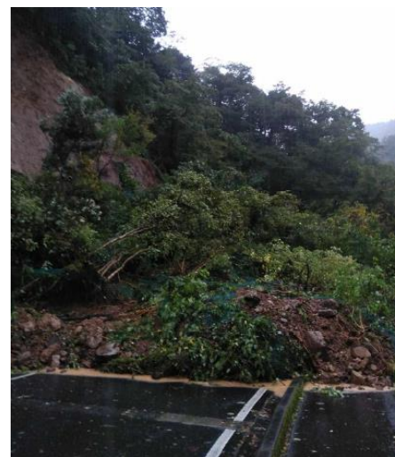
(主)鳥取鹿野倉吉線(三朝町三朝) 土砂崩落