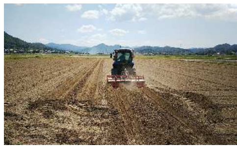
自動操舵システムによる白ネギ植付け用の溝掘り