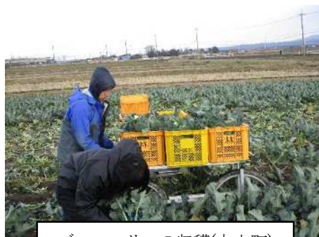
ブロッコリーの収穫(大山町)