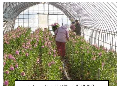
ストックの収穫（北栄町）