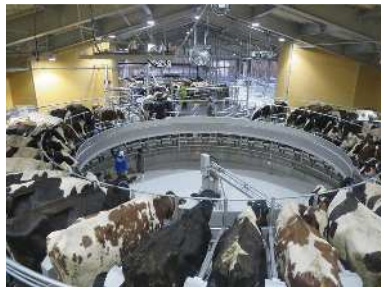
「(株)ブッシュクローバーズ」 (R元.10完成、大山町)