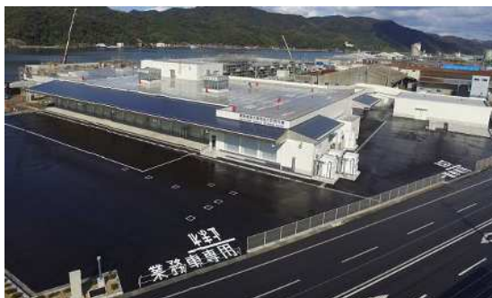
供用開始の陸送上屋（R. 6）

首都圏や関西圏など大規模消費地での鳥取県フェアや中国地方の小売店で販売される水産物のパッケージに新市場のシンボルマークを使ったシールを貼るなどして、水産物の活きの良さをアピールしている。