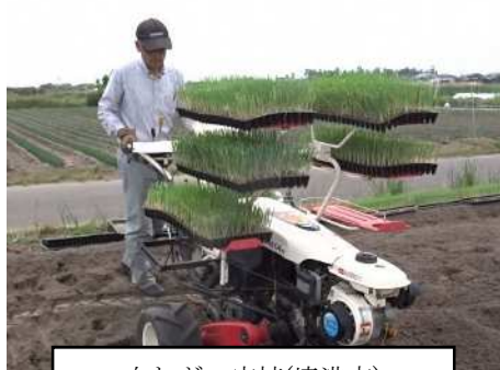
白ねぎの定植(境港市)