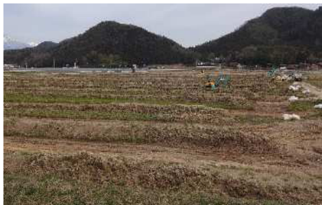
暗渠排水整備による水田汎用化