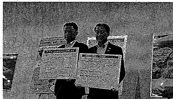
共同宣言、メッセージの合意