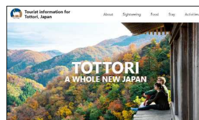
英語版のトップページ

※英語版トップページのアドレス https://www.tottori-tour.jp/en/