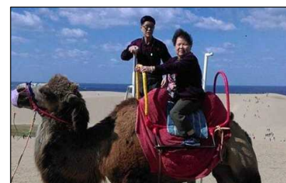
台湾からの投稿例

全市場向けに6月19日から7月19日まで、Facebook及びweiboにおいて、鳥取県を旅行した思い出(又は行ってみたい場所)を写真付きで投稿する取組を実施したところ、40万人以上がこの告知を閲覧し、6万人以上から「いいね!」等の反応があったことから、鳥取県の観光地や食に対する高い関心が伺えた。