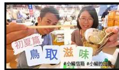
香港向け動画のイメージ

YouTube上に開設している海外向け動画チャンネル「Visit Tottori, Japan」及びSNSにおいて、6月から7月まで、国際交流員がお薦めする県内観光地をインターネットで毎週配信したところ、6月20日にFacebookで配信した香港向け動画(鳥取の初夏の味覚)は、閲覧回数7千回以上を記録するとともに、「また行きたい」、「美味しそう」等のコメントが複数寄せられた。