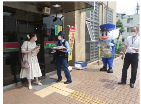
【6/15 年金支給日広報（鳥取中央郵便局）】