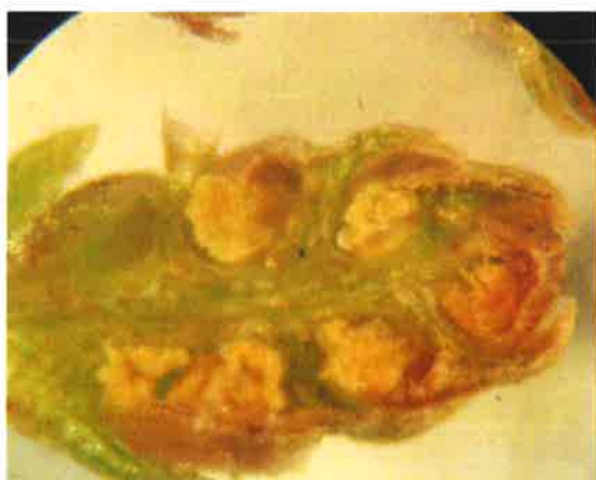
写真1 切断した雄花の断面（無花粉個体）