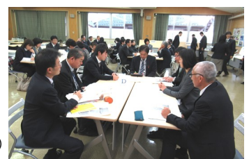
家庭学習の質向上研修会での情報交換の様子（令和元年12月）