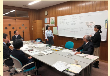
町教育会教務主任会 (八頭中学校区)

本事業実施校では、各市町の教育委員会担当者が推進リーダーとなり、各校の担当で構成する「推進チーム」が協議を重ねながら、中学校区の課題の解決に向けた実践を進めています。中学校区で課題を共有し、学校や地域の強みを生かしながら、課題解決に向けた実践を検討していきます。