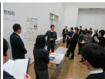
家庭学習の質向上研修会でのポスターセッションの様子（平成31年2月）