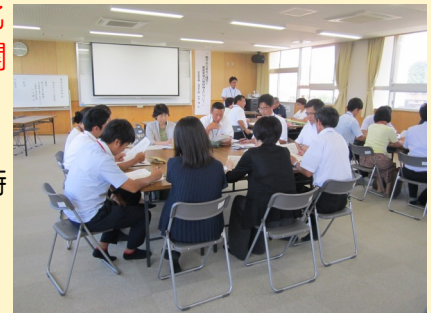
小中合同研修会での協議 (青谷中学校区)