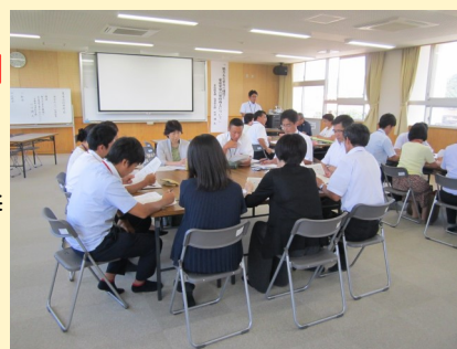
小中合同研修会での協議 (青谷中学校区)

○中学校区の研修会でアンケート結果を共有し、対策を協議する。そして、メディアに関する講演会や授業を企画・実施する。