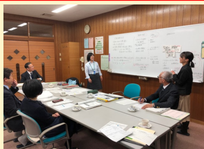
町教育会教務主任会 (八頭中学校区)

本事業実施校では、各市町の教育委員会担当者が推進リーダーとなり、各校の担当で構成する「推進チーム」が協議を重ねながら、中学校区の課題の解決に向けた実践を進めています。中学校区で課題を共有し、学校や地域の強みを生かしながら、課題解決に向けた実践を検討していきます。