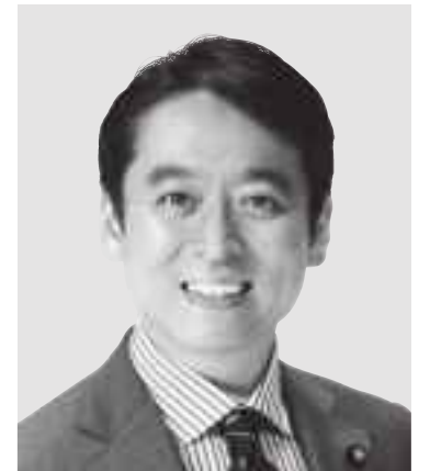
ひら き 平木 だいさく 現 役職:元経済産業大臣政務官。 参院議員1期。 経歴:東京大学法学部卒。 年齢:44歳