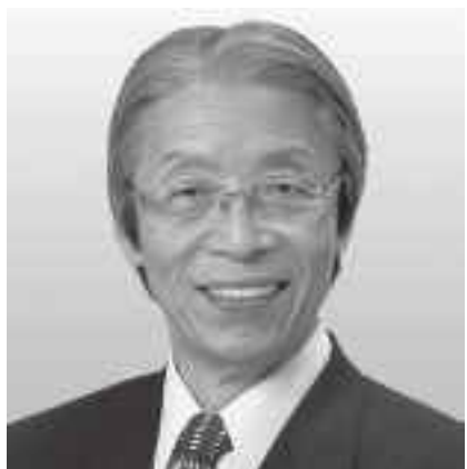
[党首] 又市 征治