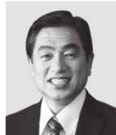
わか まつ 若松 かねしげ 現 役職:元復興副大臣。参院議員1期。 経歴:中央大学二部卒。公認会計士。 税理士。行政書士。 年齢:63歳