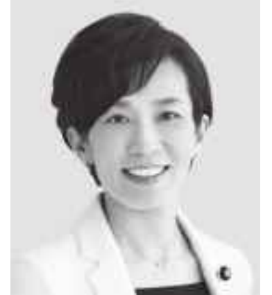
やま もと 山本 かなえ 現 役職:元厚生労働副大臣。 参院議員3期。 経歴:京大文学部卒。 年齢:48歳