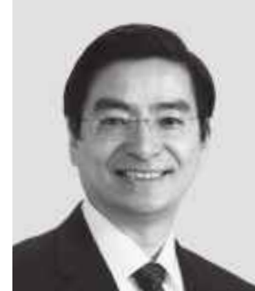
やま もと 山本 ひろし 現 役職:元財務大臣政務官。 参院議員2期。 経歴:慶應義塾大学法学部卒。 年齢:64歳