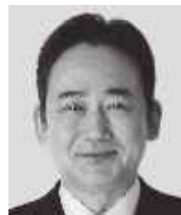
いしがみ としお 石上 としお 参議院議員 現職 全力で聴く。全力で届ける。 全力で挑む。