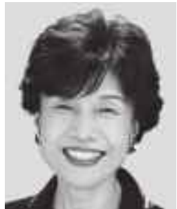
まじか こ 円 より子 元参議院議員 元職 世直しおばあ、子育てで世代全力応援