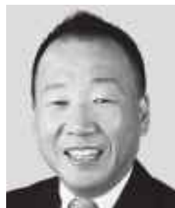
おおしま くすお 大島 九州男 参議院議員 現職 平和憲法の精神を守ります