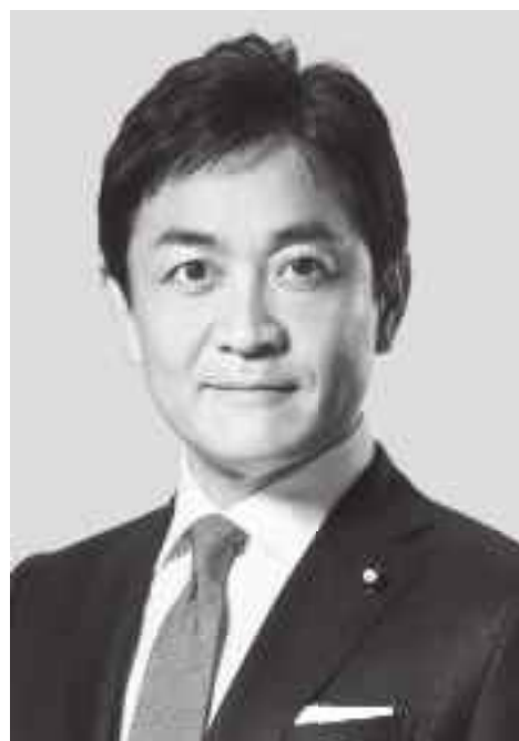
国民民主党 代表 玉木雄一郎