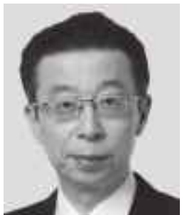
はまの よしふみ 浜野 よしふみ 参議院議員 現職 まっすぐに力強く!働く仲間のために!