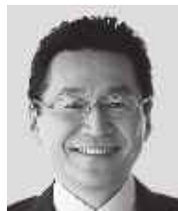
いそざき てつじ いそざき 哲史 参議院議員 現職 仲間の思い、かたちにしたい。