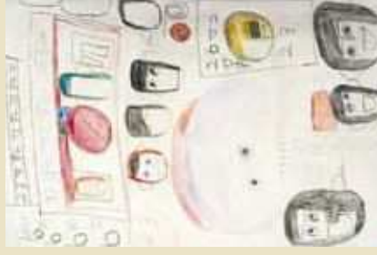
平田 和子 (社会福祉法人山形県社会福祉事業団山形県慈恵園 / 鶴岡市)