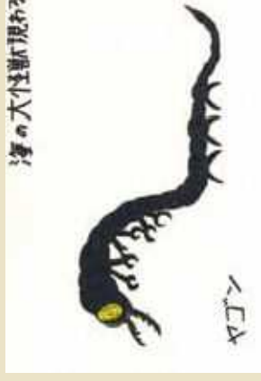
平 祐成 (南陽市)