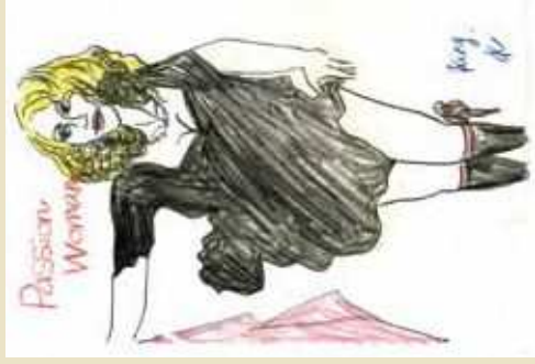
King, K (一般社団法人アート・インクルージョン / 仙台市)