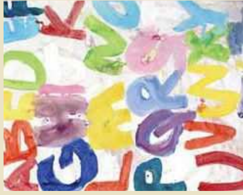
堀江 望海 (Wonder Art Studio (ARTS for HOPE) / 仙台市)

2018年から開催し3回目の宮城と山形の作家の交流展です。今回は宮城県のイチオシ・新人作家と、ぎやらりーら・らが1年間の活動で出会った山形県の注目アーティストをご紹介します。作品と共に、作家の作品制作の背景やプロフィールをご紹介します。環境などもお伝えします。