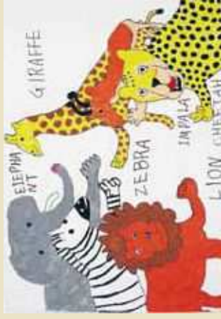
有我 樹 (Wonder Art Studio (ARTS for HOPE) / 仙台市)