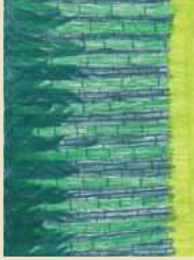
Saiko (一般社団法人アート・インクルージョン / 仙台市)