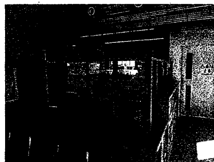
受付カウンターパネル