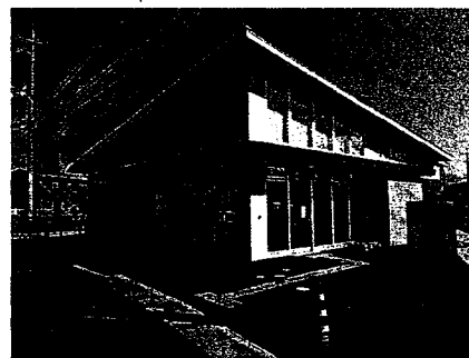
観音寺新町交番の外観

観音寺新町交番の所管区 → 東福原交番の所管区の一部(赤枠) + 米子駅前交番の所管区の一部(赤枠)