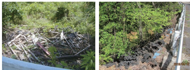
いまだに後を絶たない不法投棄