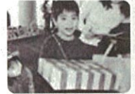
「模擬一億円パック重さ体験コーナー」の様子