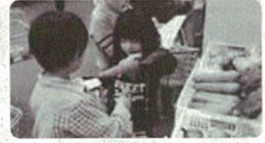
「カレー作りゲーム」の様子