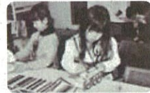
「貯金箱作り」の様子

車型2種類と新幹線型の貯金箱のどれかを選んで、マジックなどで好きな色を塗り、自分だけの貯金箱に仕上げるすることができます。未就学児もご参加いただけます。