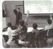
おはなし会の様子