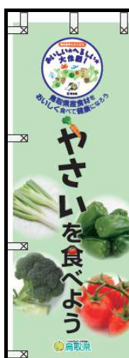
のぼり (H1800 × W450) ミニのぼり (H300 × W100)