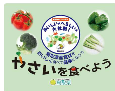
ポップ・シール (H125 × W155) ポケットティッシュ (H73 × W104)