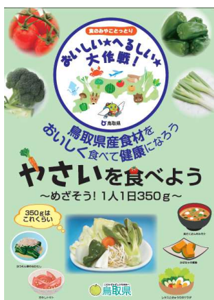
ポスター (A2サイズ) チラシ (A4サイズ)