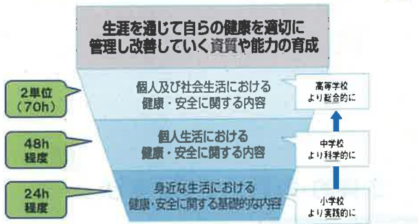
生きる力を育む小学校保健教育の手引(文部科学省H31.3)