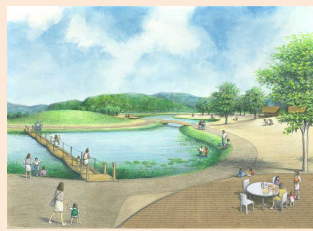
青谷上寺地遺跡の整備イメージ

「鳥取県埋蔵文化財センター 青谷調査室」から「とっとり弥生の王国推進課 青谷上寺地遺跡整備室」へと組織が変わりました。これまで以上に、青谷上寺地遺跡の調査、整備、活用などに取り組んでいきますので、応援よろしくお願ひします。