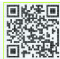
▲川の水位情報QRコード▲