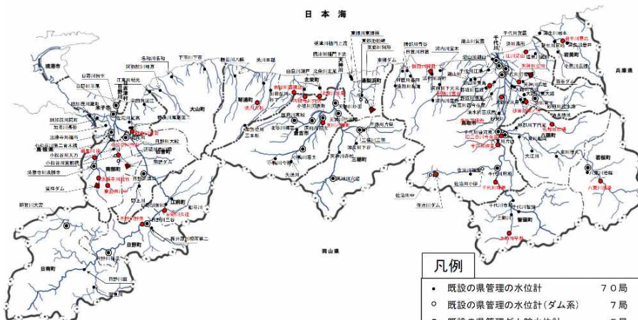
県内水位観測局位置図