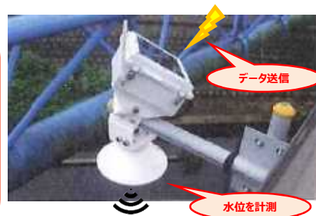
危機管理型水位計の設置例