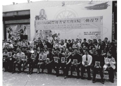
写真 国際マンガサミット台湾大会の参加者

2012年に米子市で開催された国際マンガサミット。昨年11月13日から15日にかけて台湾の高雄市でも開催されました。台湾はもとより、日本、中国、韓国、香港等から150名以上の漫画家や漫画関係者が集まり、各国の創作活動等について報告がありました。交流会の席では、鳥取県まんが王国官房長が発表されたばかりの「鳥取砂丘コナン空港」愛称化についてPRし会場をわかせました。