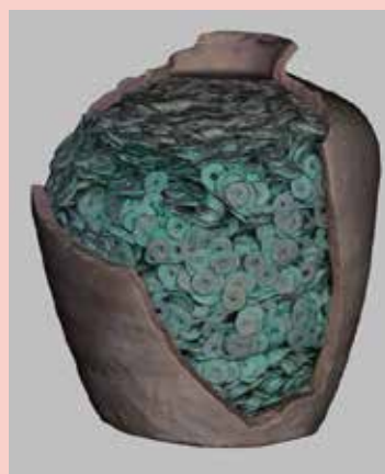
たくさんの銅銭が詰まった備前焼の3D画像