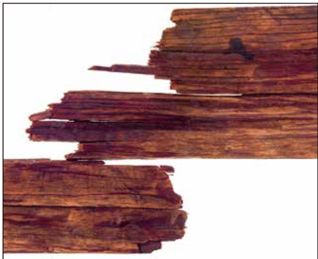
見えにくかった 青谷横木遺跡の女子群像が・・・

会期：令和元年8月3日（土）から8月25日（日）まで 会場：鳥取県埋蔵文化財センター