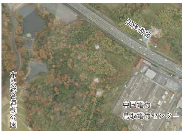
木々におおわれた山を 飛行機でレーザー測量すると・・・