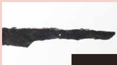
◀ 古墳時代の 刀の柄

金属製品を壊さずに調べる方法って、 病院でしている検査と同じことを やっている！？