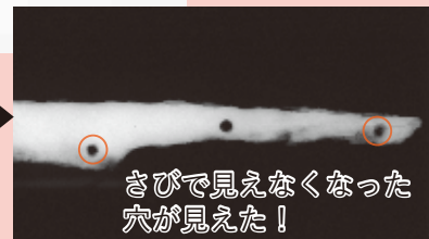
▶ さびで見えなくなった 穴が見えた！