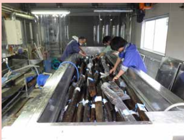
木製品の保存処理をしている様子