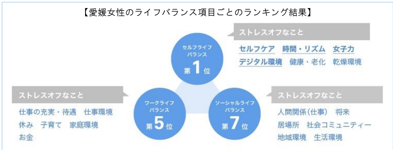
【愛媛女性のライフバランス項目ごとのランキング結果】

昨年の4位から1位になった愛媛県が大きく変化した点は、高ストレス者の割合が減少したことです。ストレスオフの要因・環境を分析し「自分の生活ペース（セルフライフバランス）」「仕事と家庭生活（ワークライフバランス）」「社会生活（ソーシャルライフバランス）」と3つのライフバランス項目に分けると、「自分の生活ペース」が1位となり、中でも“セルフケア”“デジタル環境”“時間・生活リズム”に関係する内容で、ストレスオフができていることがわかりました。