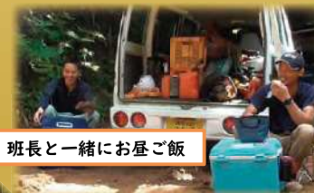
班長と一緒に昼ご飯