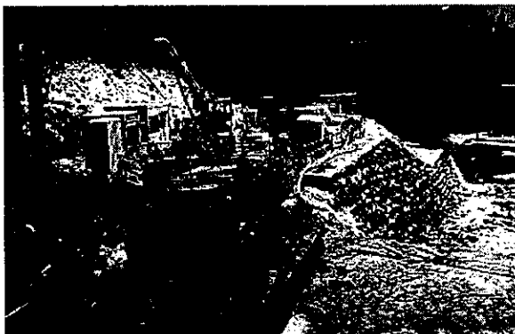
【3号無圧隧道】 久曾木谷川搬入口