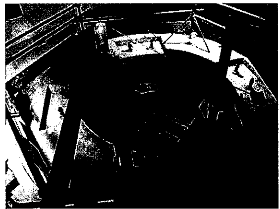
【発電所地下】 発電機基礎