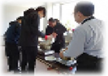
カレーライスパーティー