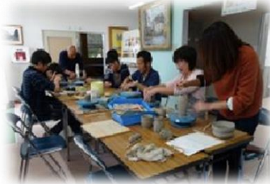
陶芸活動「手びねり」