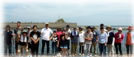
合同体験活動(魚釣り)