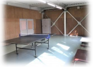
トレーニングルーム