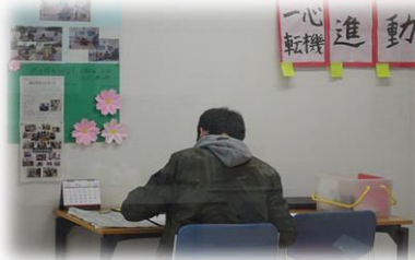
目標に向かって学習