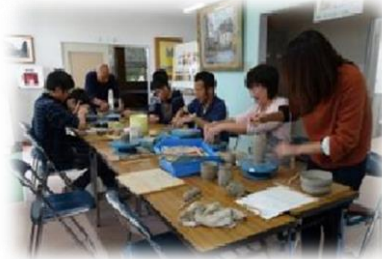
陶芸活動「手びねり」