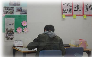
目標に向かって学習