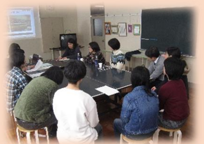
就労に向けた座談会