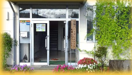
中部ハートフルスペース