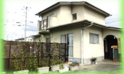
西部ハートフルスペース