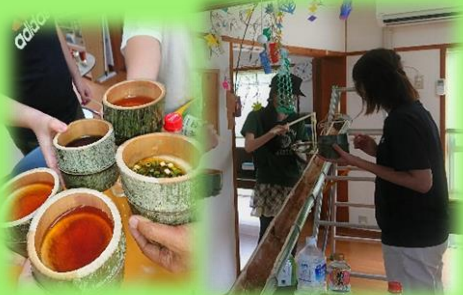
体験活動「流しそうめん」