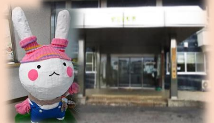
東部ハートフルスペース