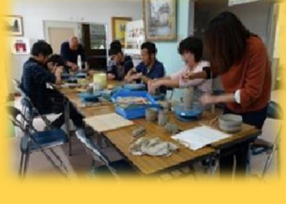
陶芸活動「手びねり」