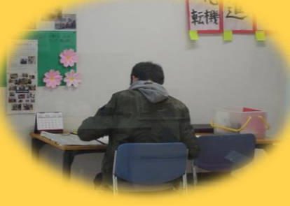
目標に向かって学習