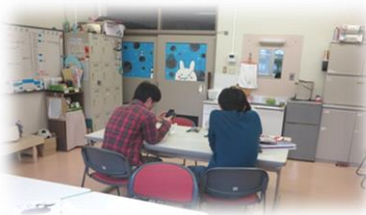
ハートフルスペース