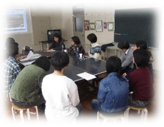
就労に向けた座談会